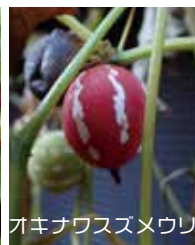
オキナワスズメウリ