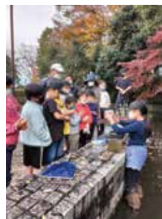
パークキッズレンジャー