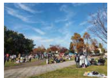
みどりのあそび市

令和4年(2022年)4月1日より、クールセンター八王子の運営を任されることになりました、NPOフュージョン長池です。みなさま、どうぞよろしくお願いいたします。1999年の法人設立以来、八王子市内で、公園の管理運営、まちづくり活動や地域での環境教育・環境保全活動など、地域に根差した活動を続けてまいりました。その実績やネットワークを活かし、センターの役割であります、地球温暖化防止活動の中間支援拠点として、その普及啓発活動、地域や団体のみなさんの交流・活性化を目指してまいります。地域のみなさまと共に、脱炭素社会を目指し、豊かな環境を未来に残していく活動をしてまいりたいと思いますので、どうぞよろしくお願いいたします。