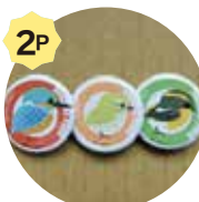
野鳥缶バッチいすれか一つ