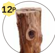
スウェーデントーチ