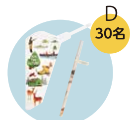
雪のコースター(雪屋ようち)