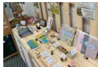
クールセンター八王子物販コーナー

クールセンター八王子では、このような“エシカルな商品”を販売していますので、ぜひお気軽にお立ち寄りください。